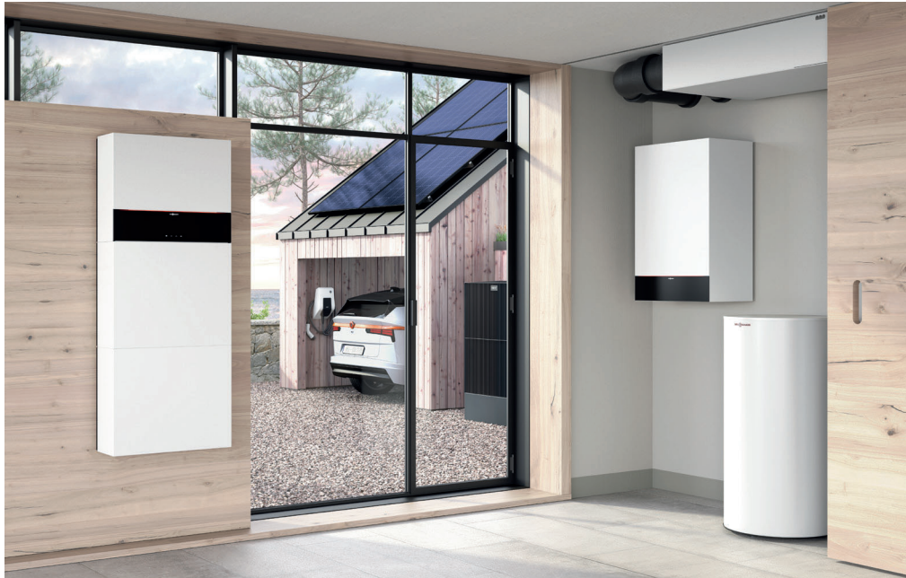
Das perfekte Energiesystem für hohe Autarkiequoten ist eine Kombination aus Photovoltaik, Stromspeicher, Wärmepumpe und einer Wallbox für das E-Auto.

Mit der Viessmann Charging Station steht Besitzern von E-Autos eine leistungsstarke und zukunftssichere Wallbox zur Verfügung.