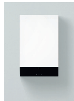
Vitodens 222-W (Typ B2LF)

Die Geräte sind für Erd- und Flüssiggas nach EN 15502 geprüft und zugelassen. Abweichende Nenn-Wärmeleistung bei Betrieb mit Flüssiggas, siehe Planungsanleitung. Warmwasser-Ausgangsleistung bei Trinkwassererwärmung von 10 auf 45 °C.