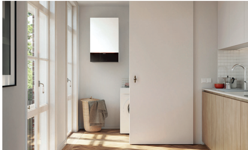
Vitodens 222-W mit attraktivem Design in der Farbe Vitoppearlwhite

Das Gas-Brennwert-Kompaktgerät Vitodens 222-W ist eine intelligente Energiezentrale, die hohe Ansprüche an eine komfortable Wärme- und Trinkwasserversorgung erfüllt. Mit modernem, funktionalem Design sowie klar gestalteten, matten Oberflächen fügt es sich harmonisch in jedes Wohnambiente ein.