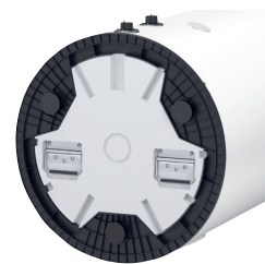
Integrierte Tragegriffe für einfache Einbringung der Speicher-Wassererwärmer