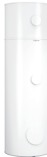
Vitocell 100-E 75 l + Vitocell 100-V 300 l