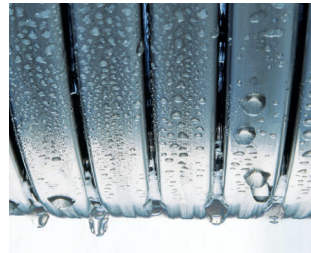
Inox-Radial-Wärmetauscher aus Edelstahl

Edelstahl macht den Unterschied. Der korrosionsbeständige Inox-Radial-Wärmetauscher aus Edelstahl ist das Herzstück des Vitodens 222-W. Er wandelt die eingesetzte Energie besonders effizient in Wärme um. Praktisch verlustfrei, mit einem kaum zu übertreffenden Wirkungsgrad von 98 Prozent. Und das mit der Sicherheit des besonders langlebigen, hochwertigen Edelstahls.