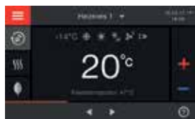
5-Zoll-Farb-Touch-Display der Regelung Vitotronic 200 (Typ HO2B)

* Voraussetzungen und Produktübersicht unter www.viessmann.de/garantie