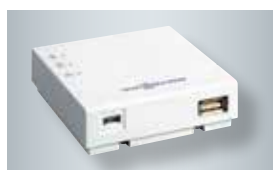
Vitoconnect mit Anschlüssen für das Steckernetzteil (links) und zur Datenverbindung